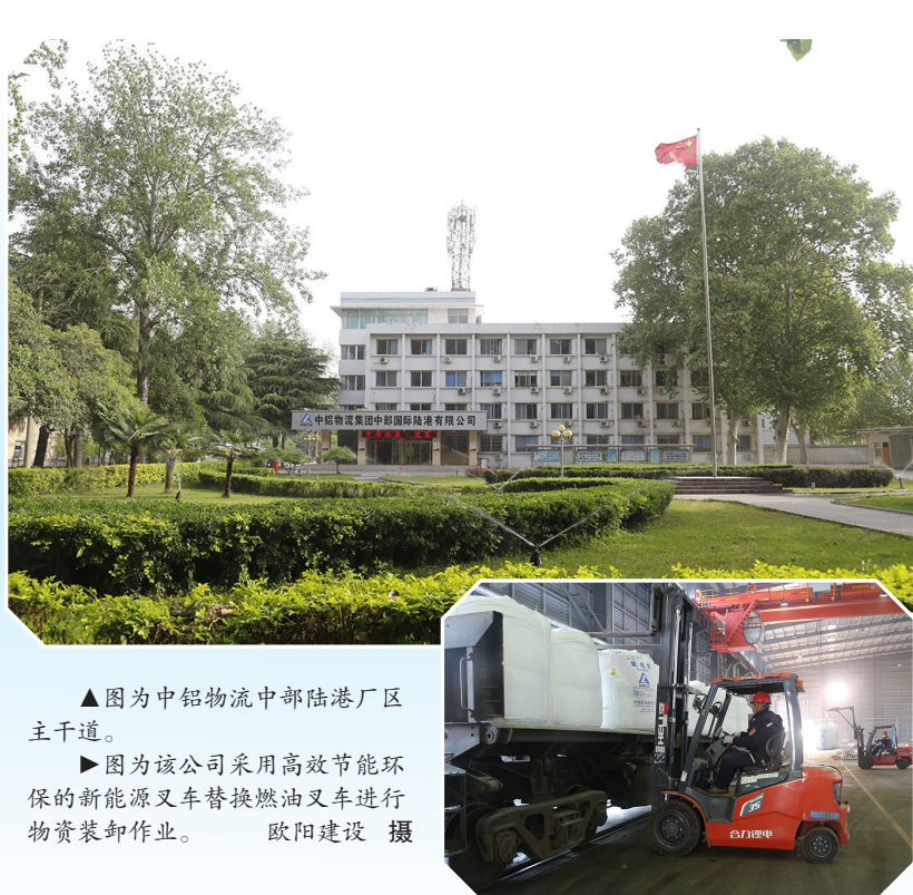
▲图中为中铝物流中部陆港区主干道。 ▶图为该公司采用高效节能环保的新能源叉车替换燃油叉车进行物资装卸作业。

该公司通过开展环保宣传教育及各项活动,增强了员工参与环保工作的自觉性,“建设生态绿色企业,保护环境从