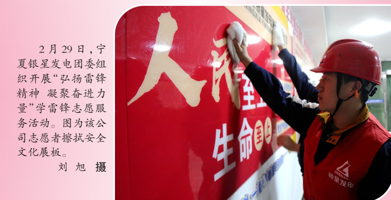
2月29日，宁夏银星发电团委组织开展“弘扬雷锋精神 凝聚奋进力量”学雷锋志愿服务活动。图为该公司志愿者擦拭安全文化展板。