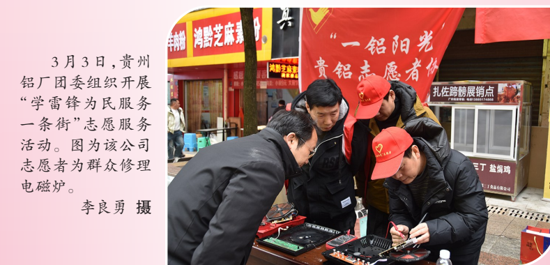
3月3日，贵州铝厂团委组织开展“学雷锋为民服务一条街”志愿服务活动。图为该公司志愿者为群众修理电磁炉。