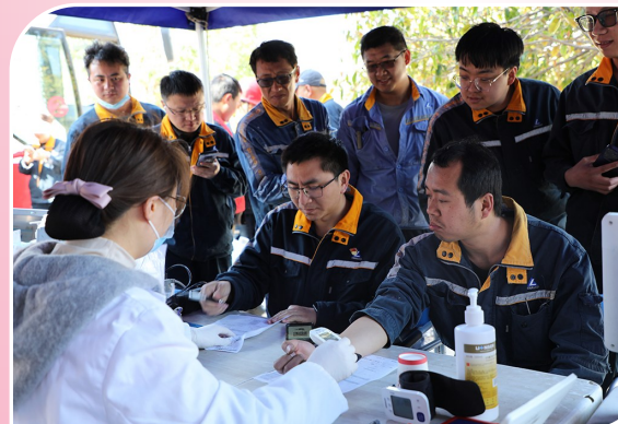
3月4日，云铝股份组织开展学雷锋志愿服务活动。图为该公司志愿者参加义务献血。