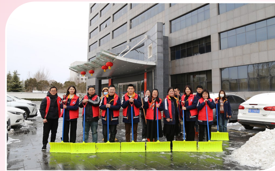
图为近日九冶安装公司组织开展扫雪除冰志愿服务活动。