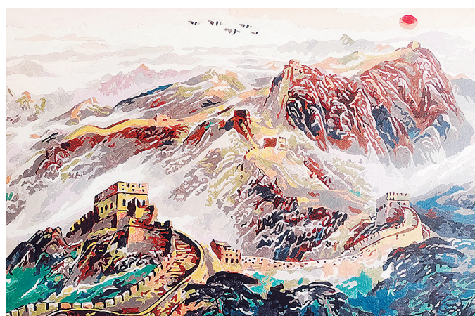
油画 云铝铝业 李学雷