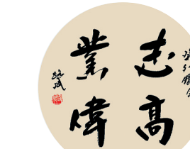
志高业伟 山东铝业 路斌