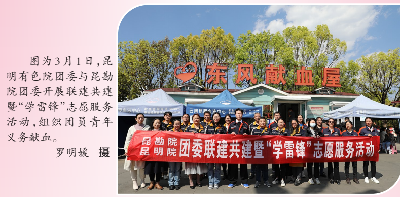
图为3月1日，昆明有色院团委与昆明院团委开展联建共建暨“学雷锋”志愿服务活动，组织团员青年义务献血。