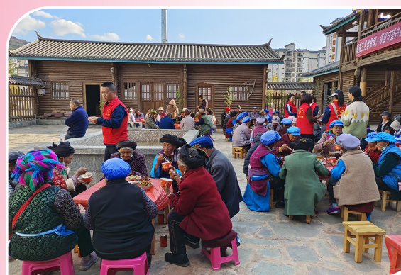
图为近日金鼎铝业团委组织志愿者为孤寡老人做爱心晚餐。