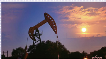
油田晨曦

进入9月,秋意渐浓。走在林间的小路上,沐浴着他们洒下的银辉,仿佛空气中弥漫着什么味道。是她甜甜月饼的味道。