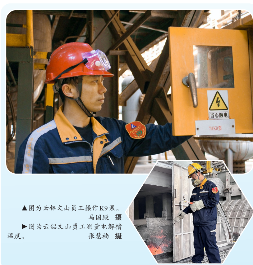
▲图为云铝文山员工操作K9泵。▶图为云铝文山员工测量电解槽温度。

为保障铝土矿资源稳定供应，云铝文山坚决贯彻落实中铝集团打造矿产资源特强的战略部署，层层压紧压实资源