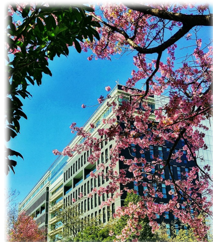
图为驰宏特铸厂厂区。王文 摄