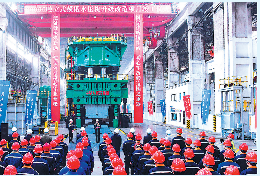
▲图为西南铝3万吨立式模锻压机升级改造项目竣工仪式现场。

本报讯 3月11日,西南铝3万吨立式模锻压机升级改造项目完成停机改造,正式竣工投产。