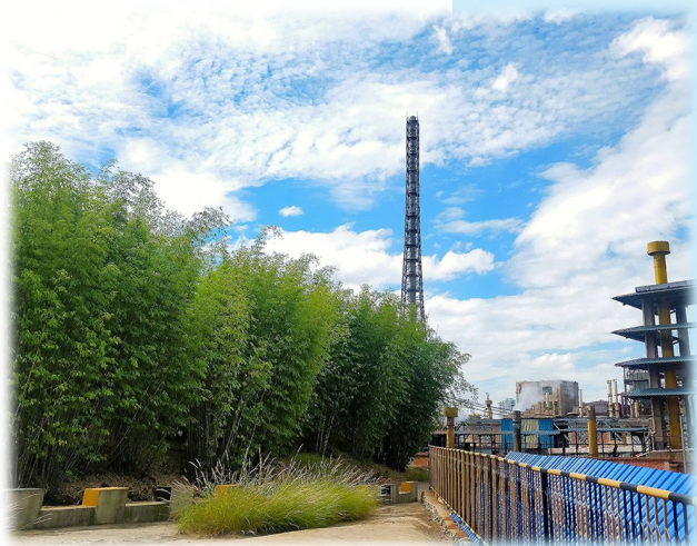
图为西南铜业硫酸厂一角。