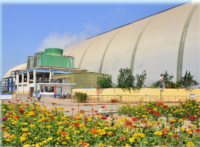
图为中铝山东第二氧化铝厂厂区。