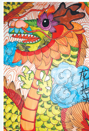
龙抬头 水彩画 云铝润涛 赵熊跃