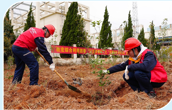
近日,驰宏综合利用团委组织团员青年开展义务植树。