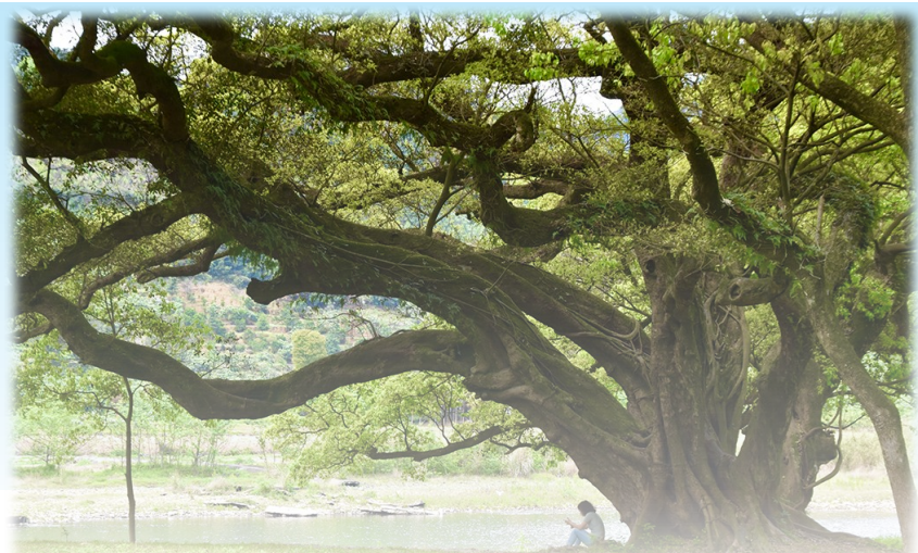
东南铜业 宋兆武 摄