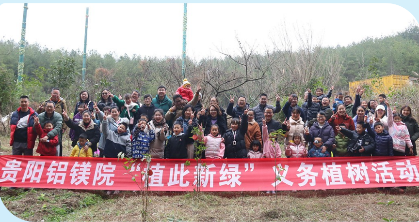
近日,贵阳院团委组织青年职工到贵阳龙里开展“植此新绿”亲子义务植树活动。