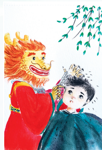
剃龙头 卡通画 西南铝 徐冲