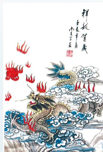
祥龙贺岁 国画 东轻 尚秀亭