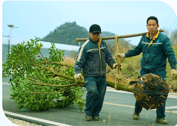
3月9日,贵州铝厂城服公司组织开展义务植树活动。