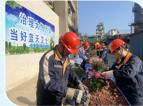
3月11日,滇中有色硫酸厂党支部、团支部组织开展植绿护绿活动。刘家慧 摄