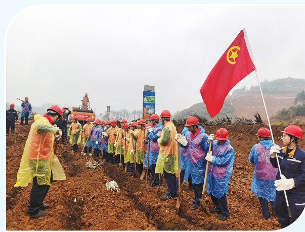
3月9日,中铝股份广西分公司团委组织团员青年到教美种植甘蔗助力复垦复绿。