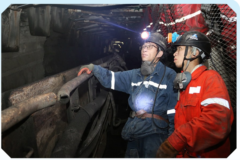
图为宁夏银星煤业综采二队维修班班长现场为新员工讲解工作面液压支架工作原理和操作步骤。

面对断层带来的诸多困难，该队每天召开班组长以上管理人员会议，集思广益，共同商讨方案。全队干部职工各显其能，经过多次现场分析和会议讨论研究，在工作面全岩段采用打眼放炮松动