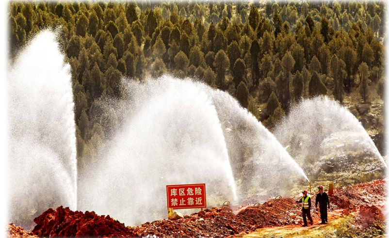
图为中铝铝业职工对赤泥库区周边绿植进行洒水维护。