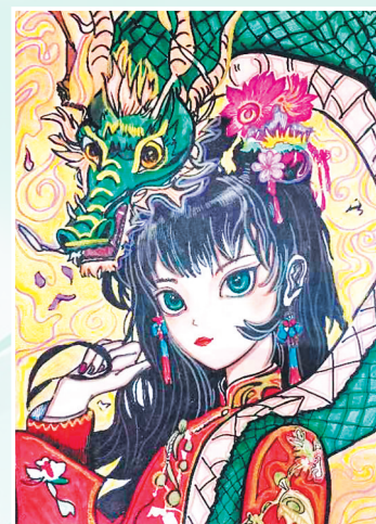
龙的传人 水彩画 包头铝业 翟慧源